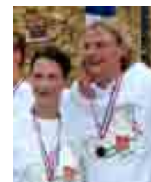
NKD veld 2011